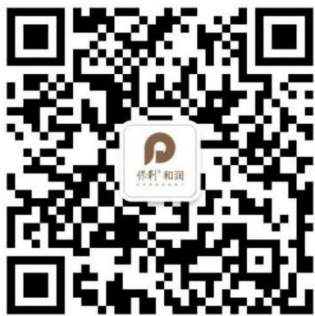
保利和润公众号二维码