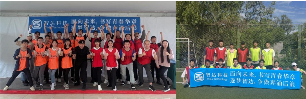
图 7 “智新生” 素质拓展