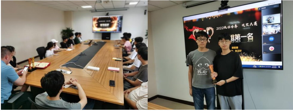
图 6 “智新生” 攻坚大赛