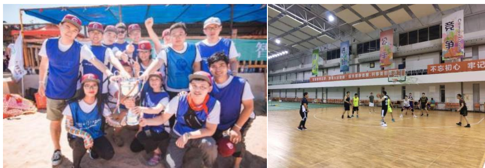
图 4 丰富的员工活动

量身定制培养计划，分层分级的培训体系，聚焦核心业务能力，提供多序列发展通道，全面助力校招生职业成长。