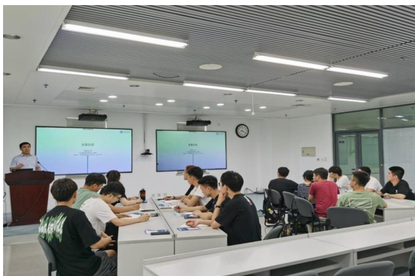
图 5 “智新生”入职培训