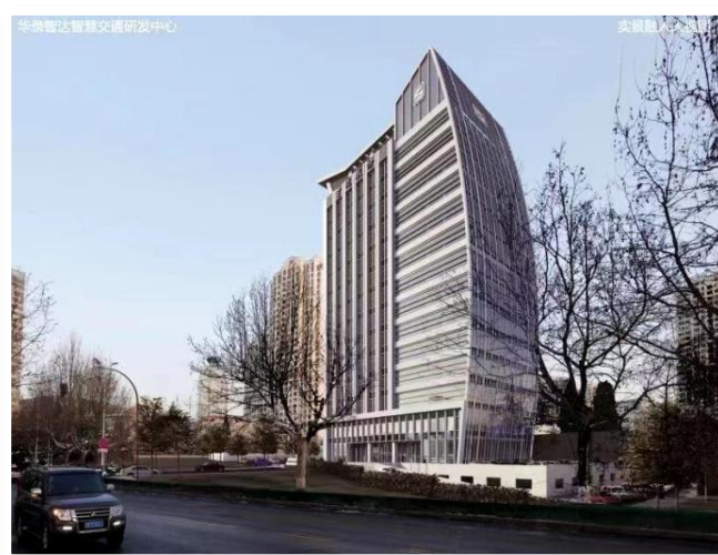
图 2 华录智达智慧交通研发中心（大连未来办公楼，正在建设中）