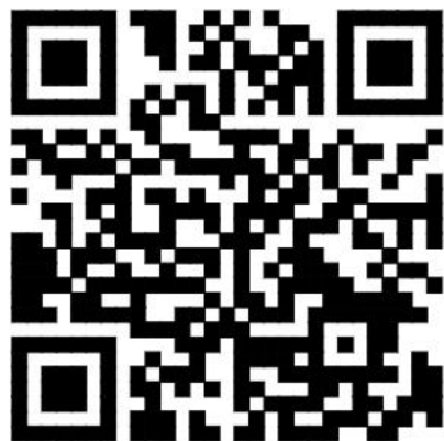
2021 年企业社会责任报告