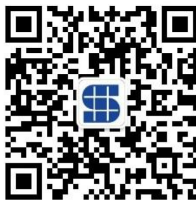
深圳城安院微信公众号