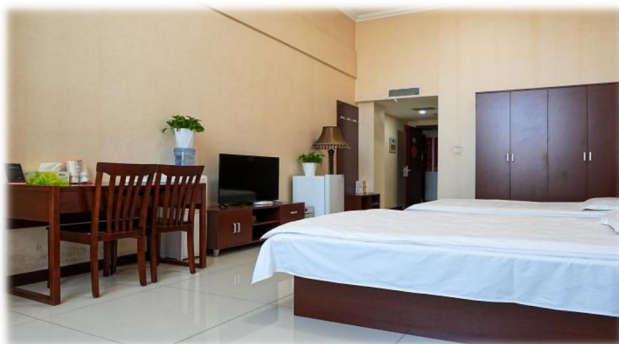
上图：食宿环境（商务区及项目公司）