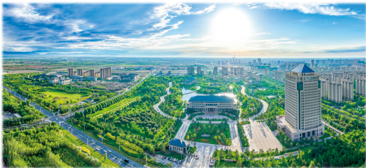
上图：特变电工总部科技研发基地