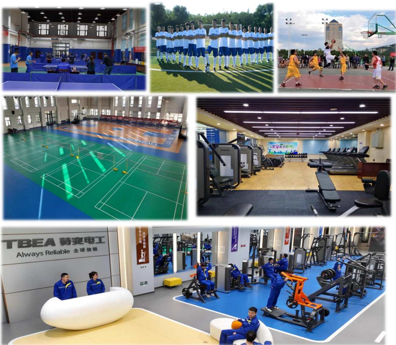
上图：室内健身、运动场所（羽毛球、篮球、乒乓球）